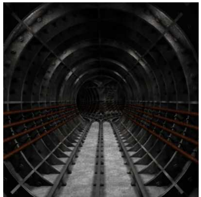
Treinbideak lurperatzea biziki kario da

Pendant ce temps, Novatrans (transport combiné rail route) supprime 30% de son effectif. Il faut voir aussi comment les terres aux alentours du rond point au bas de St Pierre d'Irube sont ravagées pour améliorer la circulation sur les autoroutes. Comprenez qui pourra !